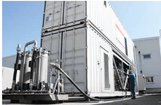
Durch die Stickstoffüberlagerung kann innerhalb der gasdichten Dekanter von FILTRATEC keine Ex-Zone entstehen. In nur einem Arbeitsgang werden drei Phasen (Öl, Wasser und Feststoff) produziert