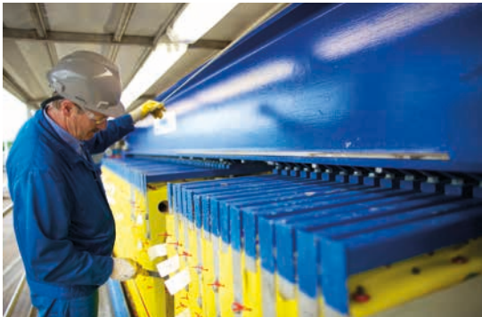
Eigenes, qualifiziertes Fachpersonal bedient unsere mobilen Anlagen vor Ort