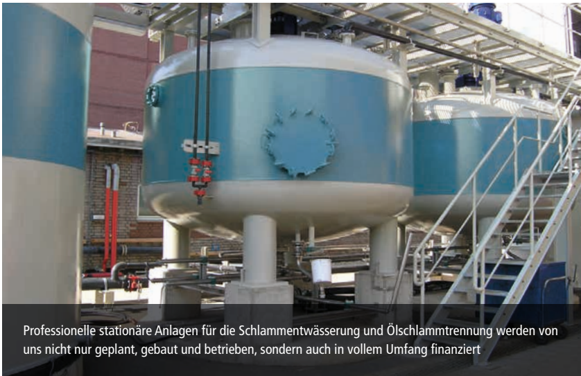
Professionelle stationäre Anlagen für die Schlammentwässerung und Ölschlammtrennung werden von uns nicht nur geplant, gebaut und betrieben, sondern auch in vollem Umfang finanziert

FILTRATEC ist spezialisiert auf die Schlammentwässerung und Ölschlammtrennung in der Industrie. Für diese anspruchsvolle Aufgabe sind wir in jeder Hinsicht gut gerüstet. Kunden aus der chemischen und petrochemischen Industrie, der Eisen- und Stahlerzeugung sowie dem Bau- und Entsorgungssektor nutzen unsere Dienstleistungen seit über 40 Jahren.